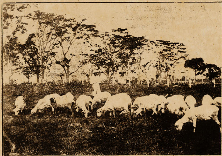
Cừu tại sở nuôi ngựa của Nhà-nước tại An-khê