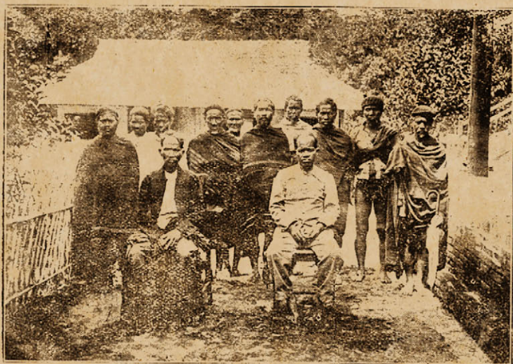
Huyền mọi và Chánh-tổng mọi tại Kontum (Dự-thăm loa ân Mọi)