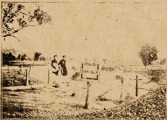
Một khúc sông Bla