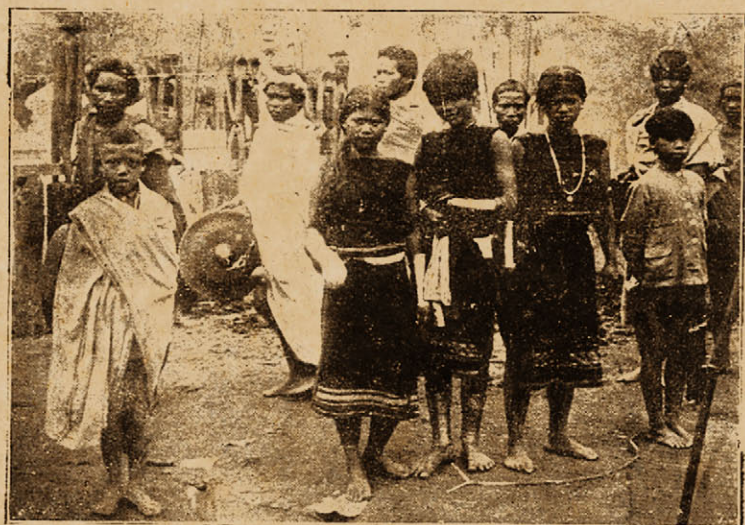
Con gái mọi Ba-na ở Kontum